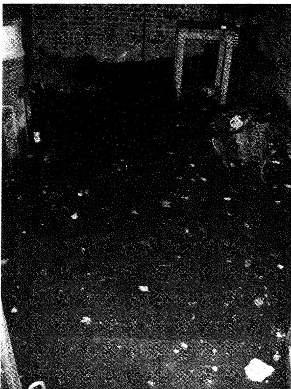
Détail de la dalle souillée