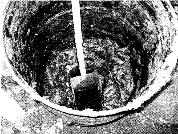
Contenu du fût de droite dans la pièce de devant, immédiatement à gauche en entrant