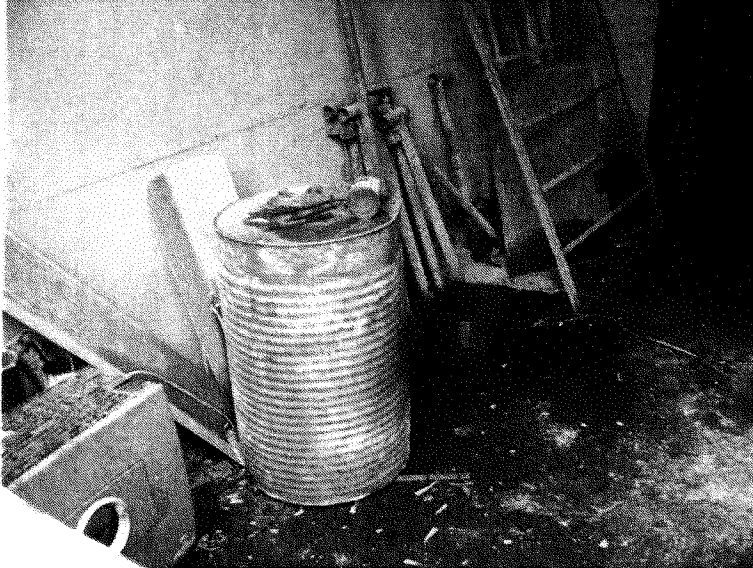
Intérieur du garage – pièce avant coté gauche