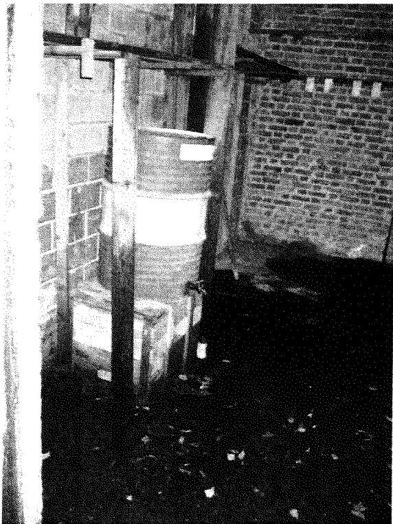
Intérieur du garage – pièce arrière coté gauche