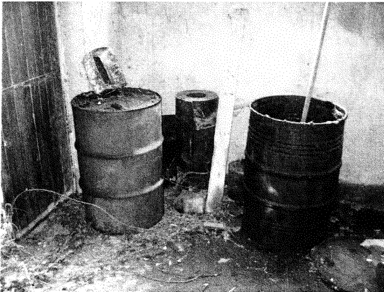
Intérieur du garage – pièce avant immédiatement à gauche en entrant – voir le contenu du fût de droite dans la photographie suivante.