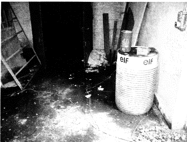
Intérieur du garage – pièce avant côté droit

Le premier atelier est divisé en deux pièces. La première renferme quatre fûts plus ou moins pleins dont un contient de la graisse consistante.