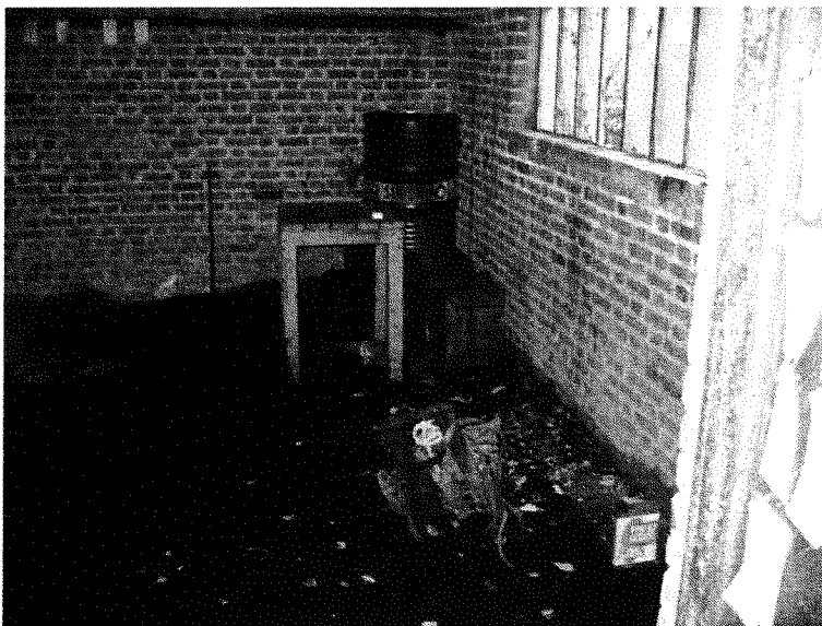
Intérieur du garage – pièce arrière coté droit